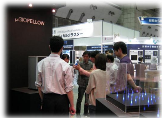
① 搬入日は昼から準備と打合せ

4月25日~27日までの3日間、東京ビッグサイトにて、Biotech2012が開催されました。