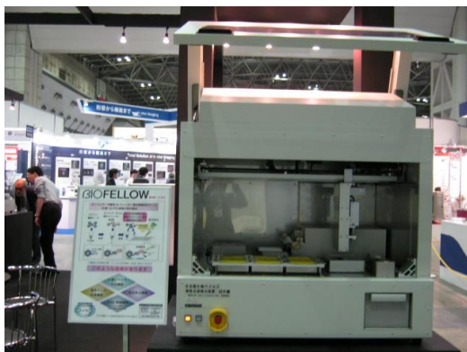
④ 微生物ウイルス検出装置