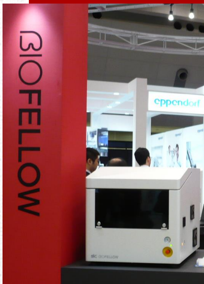
BIO FELLOW glyco